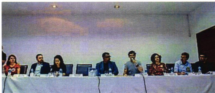
Debate com candidatos à prefeitura do Recife na UFPE com cadeira de João Campos vazia

Encontro foi realizado na sede da Associação dos Docentes da Universidade Federal de Pernambuco (Adufepe), no campus Recife, ontem